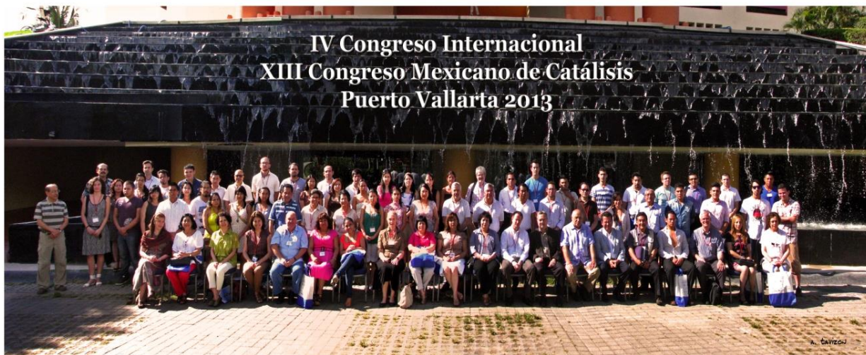
Figura 4. Participantes en el XIII CMC. (2013).