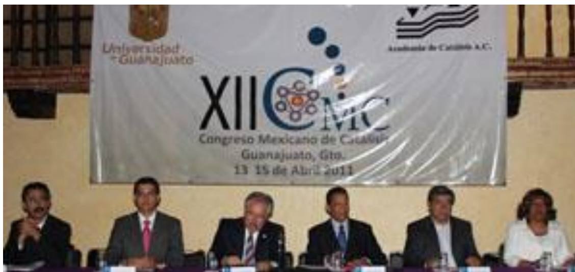
Figura 1.- Ceremonia de inauguración del XII Congreso Mexicano de Catálisis.

En el marco del evento se otorgó un reconocimiento a dos científicos extranjeros que participaron activamente en la formación de investigadores en el tema de catálisis en México, el Profesor François Figueras y el Profesor Michel Vrinat. En el evento se presentaron mas de 100 trabajos, y el ambiente fue propicio para la discusión del trabajo en los temas de catálisis, la presentación de ideas sobre el futuro de la catálisis y el reconocimiento a los pioneros en México de este campo de la ciencia.