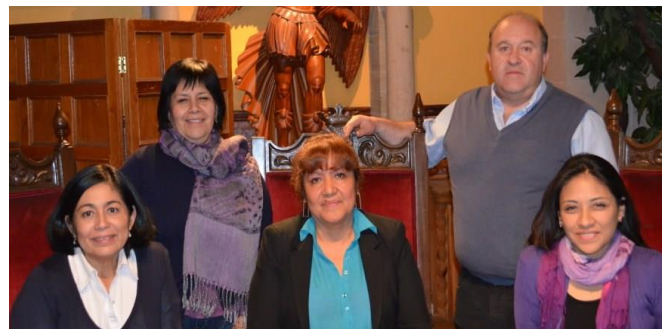
Figura 3. Reunión de Trabajo del CD, Guanajuato (2013).