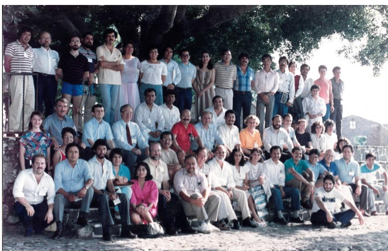
Figura 1. I Seminario Internacional de Catálisis Heterogénea, 21-24 de septiembre 1988.

Sirva este espacio para felicitar a todos, miembros de los Consejos Directivos y socios de la ACAT, por su participación a lo largo de los años para hacer de la Academia de Catálisis A.C. una asociación que todos consideremos nuestra.