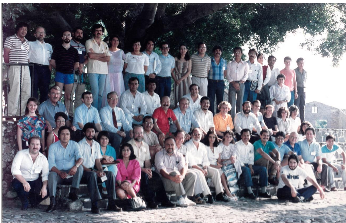
Figura 1. I Seminario Internacional de Catálisis Heterogénea, 21-24 de septiembre 1988.