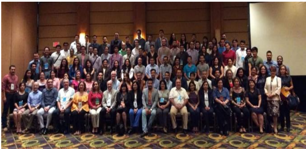
Figura 2. Participes Asistentes al XVCMC

Asimismo, en colaboración con la RED TEMATICA (PRODEP) de Materiales Aplicados al Medio Ambiente de la UAM-Azcapotzalco se realizó un III Simposio Nanotecnología y Calidad Ambiental y III Coloquio del Posgrado en Ciencias de la Ingeniería (noviembre 2016) con invitados del Grupo de Tamices Moleculares del Instituto de Catálisis y Petroleoquímica de Madrid, invitados nacionales y de empresas relacionadas con el Medio Ambiente.