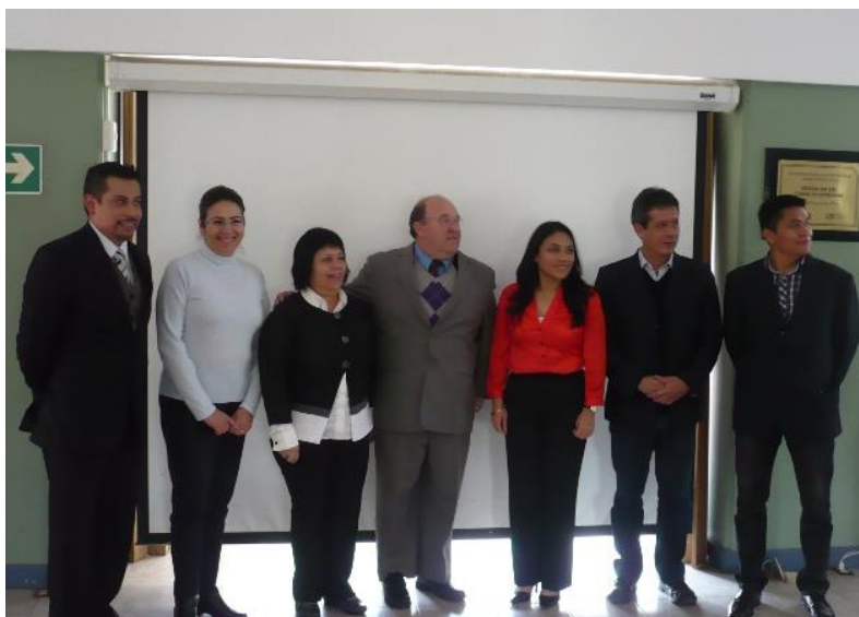
Figura1. Miembros del CD 2013-2015.