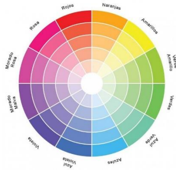
Figura 2. Círculo Cromático.

Sin embargo, ¿Por qué no vemos el color rosa en el arcoíris? ¿Acaso no existe? Resulta que dependiendo de a que color se le denomina “rosa”, existen diferentes explicaciones. La primera de ellas es que al cerrar el espectro de luz visible en un círculo (Círculo cromático), como se observa en la Figura 2. Al mezclarse ambos extremos del arcoíris se forma un color rosa y el motivo por el que no vemos este color en él, es porque estos extremos nunca llegan a tocarse del todo. Otra de las explicaciones es que en realidad el color rosa es un tono más claro del color rojo.